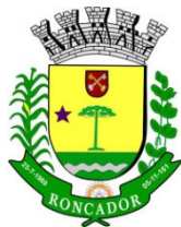
PREFEITURA MUNICIPAL DE RONCADOR